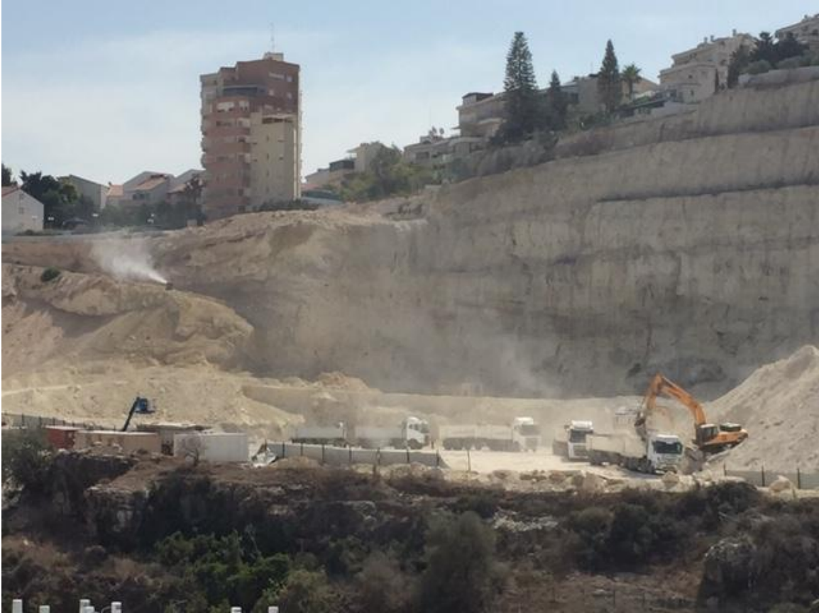
תותח ערפול באתר ורדיה