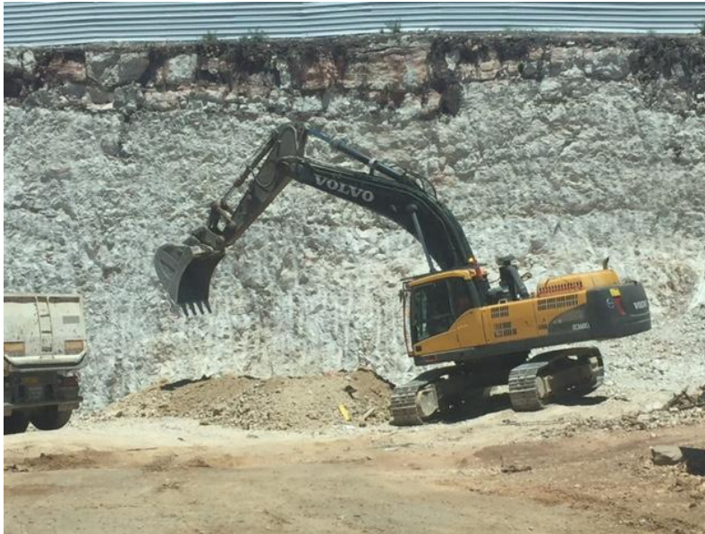
עבודות תשתית ברח' ברל כצלסון

עם תחילת העבודות בניה בפרויקט זה, הגיעו אלינו תלונות נוספות על מטרדי האבק. נערכו סיורים בשטח ובהמשך נשלחה חוות דעת הכוללת ממצאים והמלצות לשימוש יעיל במים לצמצום המטרדים.