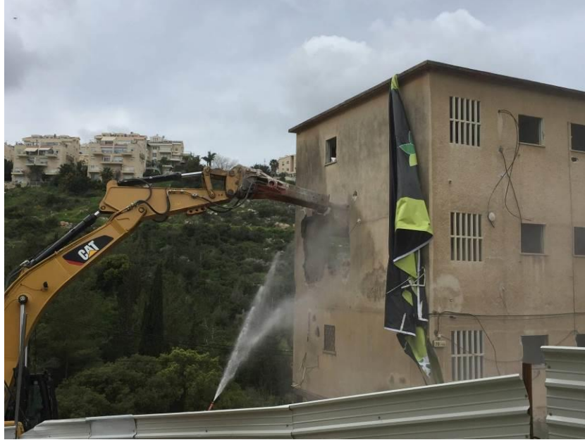
הריסת מבנה ברח' ברל כצלסון

עם תחילת העבודות בניה בפרויקט זה, הגיעו אלינו תלונות נוספות על מטרדי האבק. נערכו סיורים בשטח ובהמשך נשלחה חוות דעת הכוללת ממצאים והמלצות לשימוש יעיל במים לצמצום המטרדים.