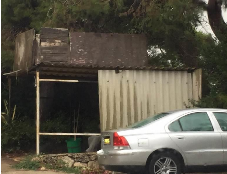
חניון פרטי עם לוחות חסרים

הפניות נבדקות בביקורים בשטח על מנת להתרשם ממצב המבנה והלוחות ולאחר מכן העברת הממצאים והמסקנות אל הגורם המפנה את התלונה (רשויות מקומיות או המשרד להגנת הסביבה) או אל התושבים.