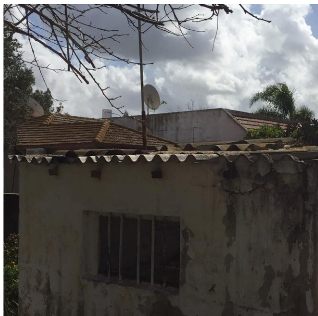
גג אסבסט-צמנט במבנה נטוש

המידע שהאיגוד מעביר אל הפונים בנושא אסבסט מתבסס על מסרים מתוך מסמך עמדה של המשרד להגנת הסביבה וכולל את הדגשים הבאים: