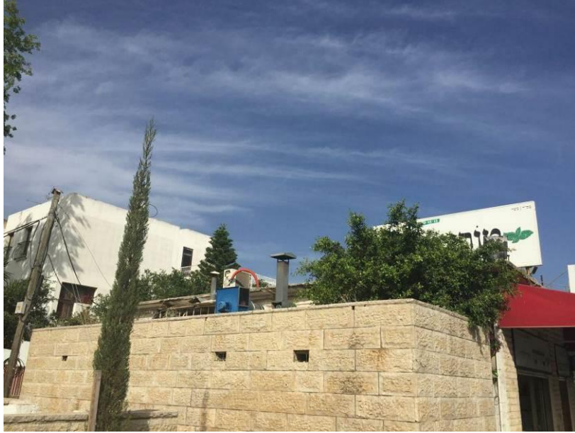
ארובת פיצריה "טורינו"

מסעדת אבו זיו, חיפה : ארובת המסעדה, אשר הותקנה כנדרש לאחר התערבות האיגוד, הוסרה וכתוצאה מכך פליטות ריחות ועשן מגיעות לדירות השכנים. האיגוד נדרש להתערב מחדש בנושא ועל כן והעביר את המלצתו לדרישה על התקנה של ארובה תקנית בגובה המתאים ( 2 מ' מעל בית השכנים) על פי ההוראות של התקנות לבתי אוכל.