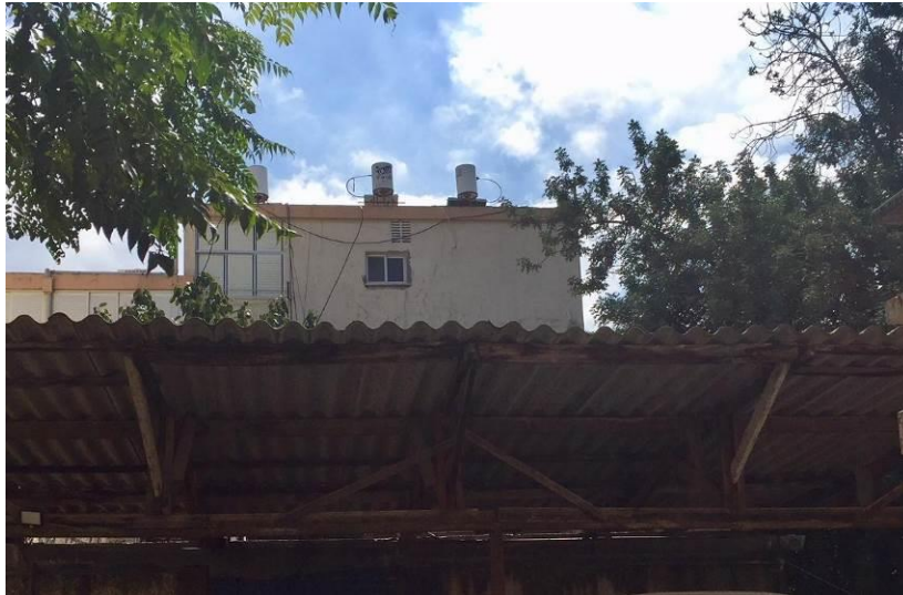
גגון חניון בנוי מלוחות אסבסט-צמנט במצב תקין

הפניות נבדקות בביקורים בשטח על מנת להתרשם ממצב המבנה והלוחות ולאחר מכן העברת הממצאים והמסקנות אל הגורם המפנה את התלונה (רשויות מקומיות או המשרד להגנת הסביבה) או אל התושבים.