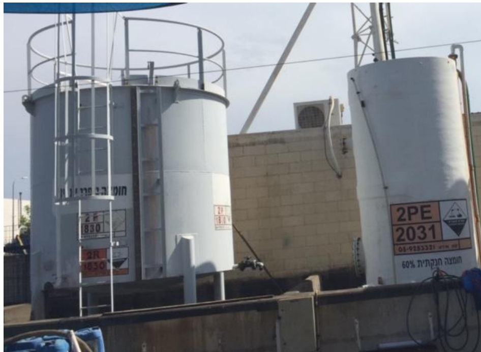
מכלי כימיקלים ממפעל אלקטרו-כלור

סוכם כי הבעלים יפעל לתיקון המצב עפ"י לוח זמנים. לשם כך יוזמן בעל מקצוע לטיפול במיכל חומצת מלח ובנשם שלו באופן שימנע נידוף אדים ממיכל. יש לוודא שגם מיכלים נוספים המכילים חומרים בעלי פוטנציאל נידוף גבוה יעברו בדיקה ותיקון בהתאם לצורך.